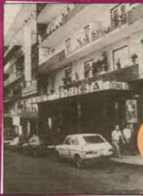
Cine Compa (1997-1997), actual SKA