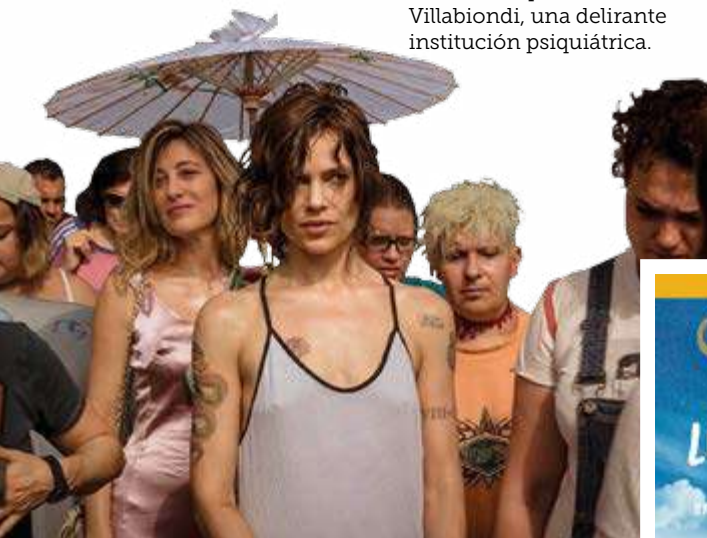
◀ Valeria Bruni Tedeschi, Micaela Ramazzotti