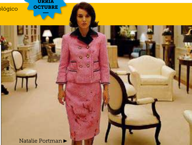
Natalie Portman ▶