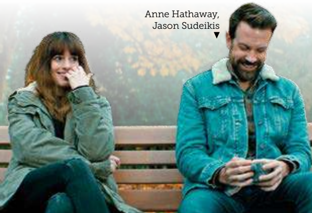
Anne Hathaway, Jason Sudeikis

2017 Neuchâtel International Fantastic Film Festival: Izakirik Onenerako izendatua/Nominado mejor criatura